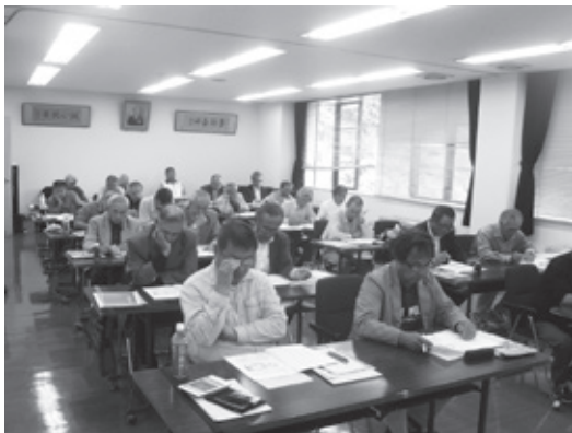
農業法人設立講座

「法人会計・パソコン農業簿記講座」（写真下）は、税理士による複式簿記記帳の講義後、パソコンによる農業簿記ソフトの操作方法を実践的に学びました。