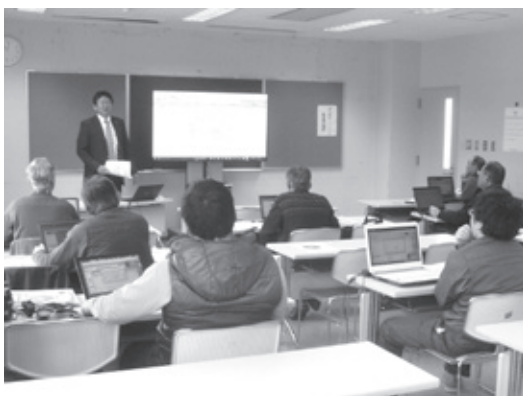
パソコン簿記講座