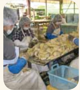
茹で上がった筍の姫皮をこそげる女性たち

連休の頃までフル回転。茹で上がって皮がむかれた筍の姫皮を、手際よくきれいに取り除く。その後大きな缶に入れて、缶詰にする。