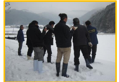
「現地見学会」の様様 (当日はあいにくの大雪でした。)

現地見学会は、南丹市にもご協力いただき、1月21日(金)午前10時から南丹市園部町船岡地区で実施しました。参加された借受希望者は4経営体。農業委員や機構から農地や地域の情報、地権者の意向など詳細な説明を行いました。参加者の理解も深まり好評でしたが、残念ながらこの時点ではマッチングには至りませんでした。