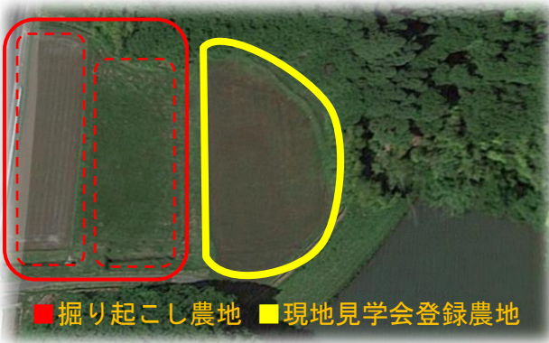
■ 掘り起こし農地 ■ 現地見学会登録農地

そのような中、地元の経営体がタイミング良く借受申込に名乗りをあげ、訪問ヒアリングを重ねるなかで、地権者からも地元担い手が望ましいとの声もあり、現地確認、意向確認を経てマッチングとなりました。地元でも事業への理解を深めていただいた結果、当初の見学会対象農地に加え隣接2筆の地権者からも農地を貸し付けていただけることとなり、3筆0.6 ㍓ の連担する農地のマッチングができました。