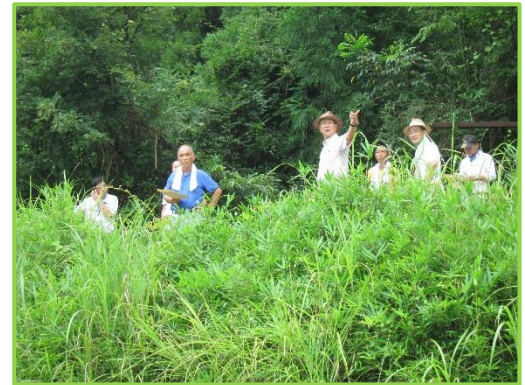
貸付登録農地を詳細に説明 (全景を見渡しながらか)

塩貝現地駐在員が詳細な農地情報を説明し、参加者から借受に前向きな質問がありました。また、当日は南丹市農政課・地元代表及び地権者も参加して頂きました。