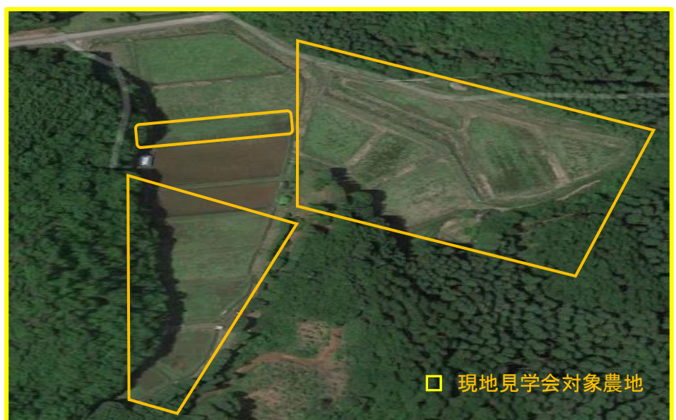
□ 現地見学会対象農地

また、経営体からも今後の農地情報提供の継続に期待する声があることから、見学会を更に充実して行きます。