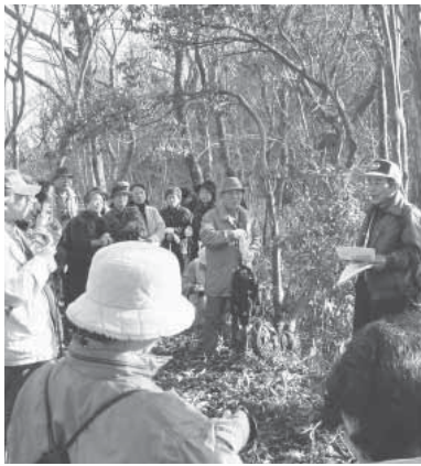
京都市内の絵画サークルが大宮町を訪れたのが交流のきっかけ（ブナ林散策ツアー）

その取組みのひとつが「パンプキン・フエスティバル」だ。町内の農家で作ったジャンボポチャの大きさを競うコンテストが開かれ、出店が並び、地域の人も訪れた人も楽しく盛り上がるという催し。平成十年、スタッフは広くPRしようとNHK京