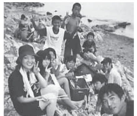
子どもセンターでは、毎年子ども達と青年リーダーが無人島一週間キャンプに取り組む

農家数34戸の板生奥地区で、共同作業で地域の農地を守り、地域農業の活性化に取り組む。同地区には、今は閉鎖された「現世スキー場」の跡地を活かして「緑の里交流センター」が平成12年に建設された。