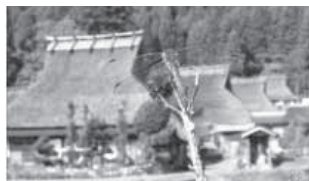
日本一の田舎づくりをめざす美山町

平成元年には、役場に村おこし課を設置し、また旧村ごとには村おこし推進委員会を立ち上げました。都市交流の拠点として、