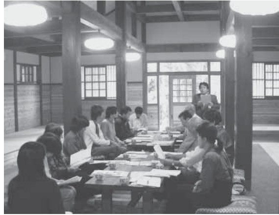
「緑の里交流センター」を拠点に交流がすすむ