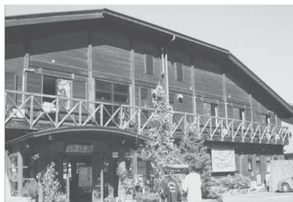
都市農村交流の拠点施設 美山町自然文化村「河鹿荘」

私どもが目指しているもう一つの柱は、新しい住民自治への挑戦です。町内の自治組織を見ますと、リーダーの高齢化とか役職の重複等が問題となってきましたし、平成十二年当時、農協の合併とそれに対応した住民出資