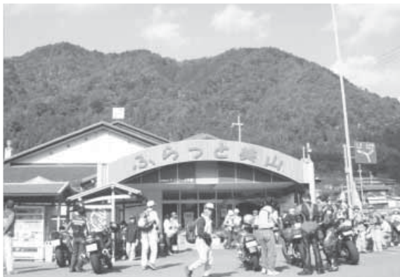
平屋地区の住民の共同出資で設立された直売施設「ふらっと美山」

た二〇人の方が役員として活動をしていきます。会計は、各戸当たり年間二〇〇〇円と、町のほつから二〇〇〇万円の補助ということで運営をしています。振興会では、住民票の発行や戸籍、公共事業の要望の窓口といった住民サービス提供と、それから地域の振興づくり、人づくりというようなことを目的に活動をしています。いま、それぞれの振興会では、都市農村交流を進めながら、地域特産物の開発や直売所などの地域産業の育成に取り組んでいます。 こうした取り組みの中で、町全体を見ると、観光客は、平成の十五年度には、七〇万人を突破しまして、この二〇年間に六倍にまでなっています。 その意味では、美山町の農林業は、多く都市の方々に支えられていると思っています。