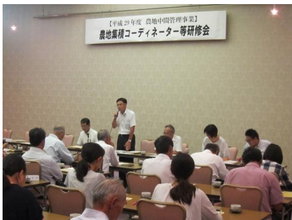
（京都市他、南部の市町村が参加した京都市会場）

府内26農業委員会のうち22農委で農用利用最適化推進委員が選任され新体制に移行し、今後、農地中間管理事業の推進に農業委員会との連携が一層大切必要な旨説明しました。