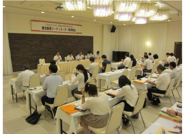
（京都府北部の市町村が参加した福知山市会場の様子）

参加者は、農地の出し手、受け手の相談等を行う農地集積コーディネーター、農地中間管理機構が窓口業務や契約の締結・変更等の手続き業務等を委託している市町村の担当者、府広域振興局担当者等、52名が参加しました。