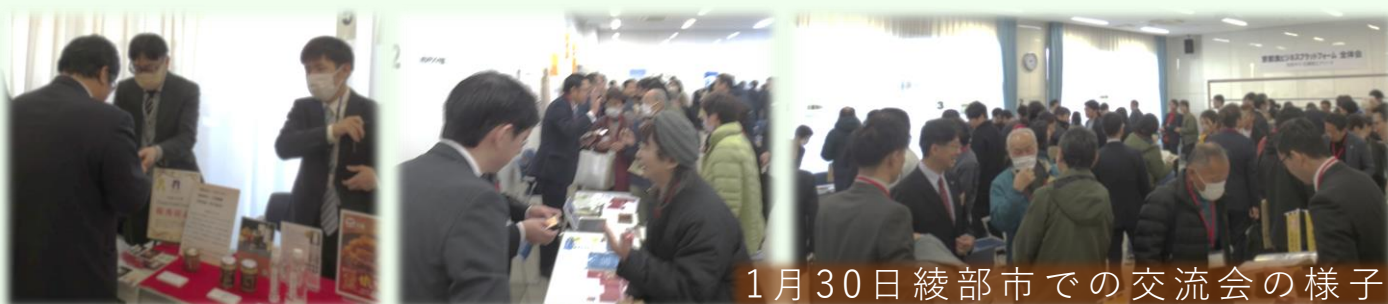
1月30日綾部市での交流会の様子

プラットフォームで開発を支援した商品がブースに並び、 開発者とお話できます。今後の取組のヒントをつかんでください。